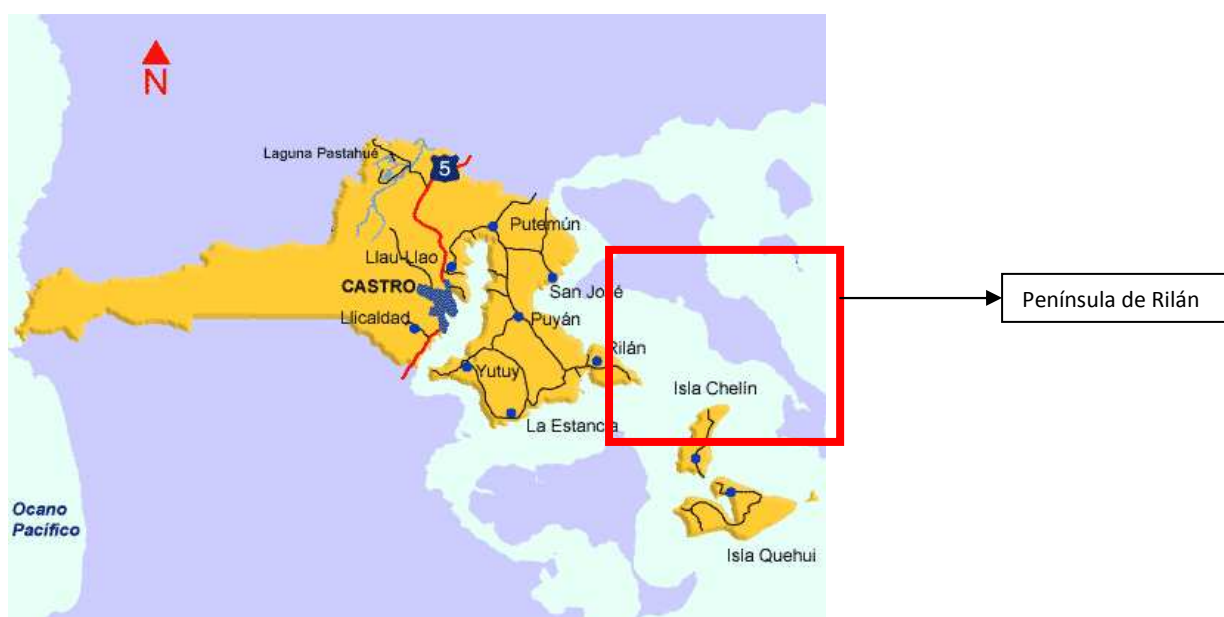
Figura Nº 2. Cartografía De La Comuna De Castro, con la ubicación de Rilán

La península de Rilán, pertenece geográficamente a la comuna de Castro, tiene forma semejante a un triángulo, con su base en el lado sur. Está parcialmente separada del resto de la Isla Grande por el fiordo de Castro y el Canal Dalcahue la separa de la isla Quinchao. Tiene una superficie aproximada de 100 km 2 y su mayor ancho, unos 18 km, se encuentra entre las puntas de Peuque y Aguantao. En la costa de la península existen varios pequeños poblados como Curahue, Yutuy, San José y Rilán, siendo este último el más grande de los tres. Por el lado que está frente a la ciudad de Castro están las playas de Quento, Tongoy y Yutuy, que son en verano balnearios bastante visitados. La población se dedica a la agricultura y la ganadería o se desplaza a trabajar a Castro y otros lugares cercanos durante el día (I. Municipalidad de Castro, 2010).